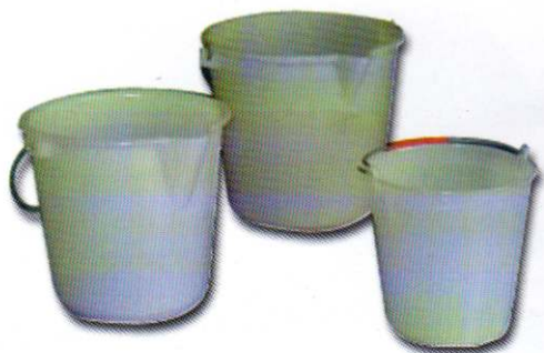
Art. 1100 Secchio industriale