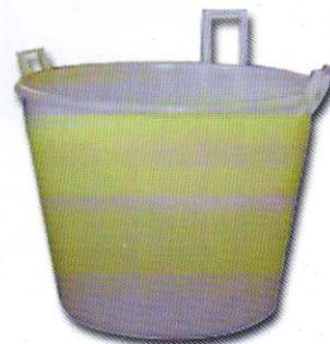
Art. 391 Mastello 3 manici