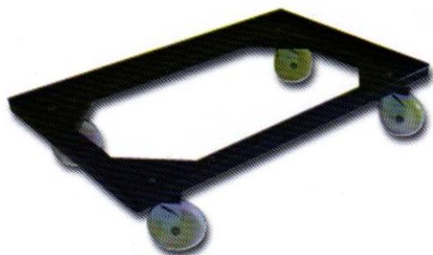
Carrelli per ceste

Le tavole sono costruite in polipropilene alimentare, conformi alle direttive 93/43/CEE, 96/3/CE e L.C. art.10 L.2/12/99 n.526, alveolate internamente con nervature di rinforzo sull'intera lunghezza.