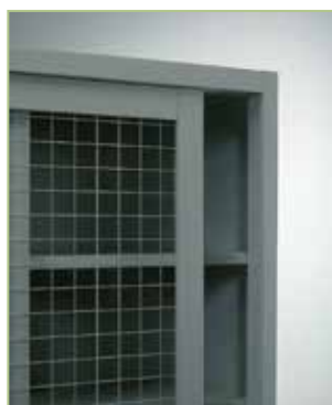
Anta in rete