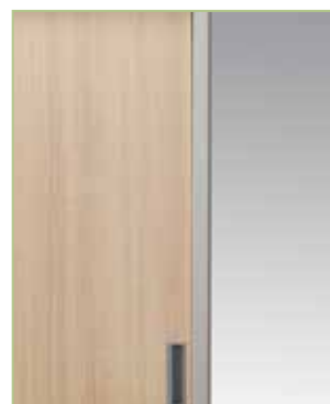
Ante in legno melaminico